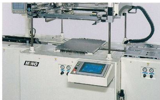
ツインテーブルのシャトル運動