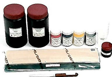
Tシャツプリント ファーストキット