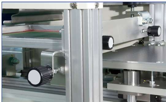
版枠微調整は簡易型の両端押ネジ式