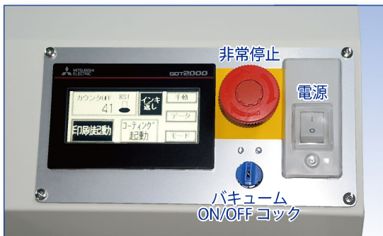
デジタル操作盤 電源は 100V