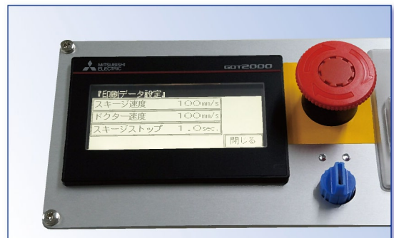
印刷ファクター タッチパネル設定