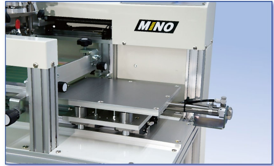
テーブルはエアシリンダーで自動スライド