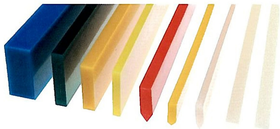
スキージブレード