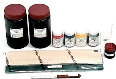
Tシャツプリント ファーストキット