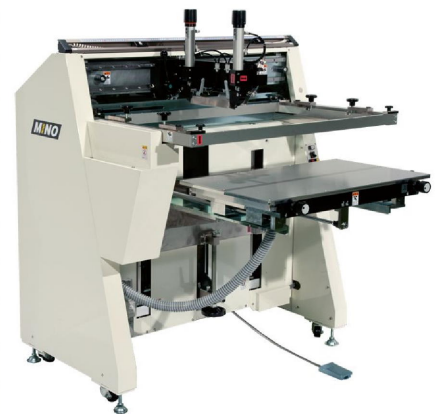
ピールオフ装置付印刷機