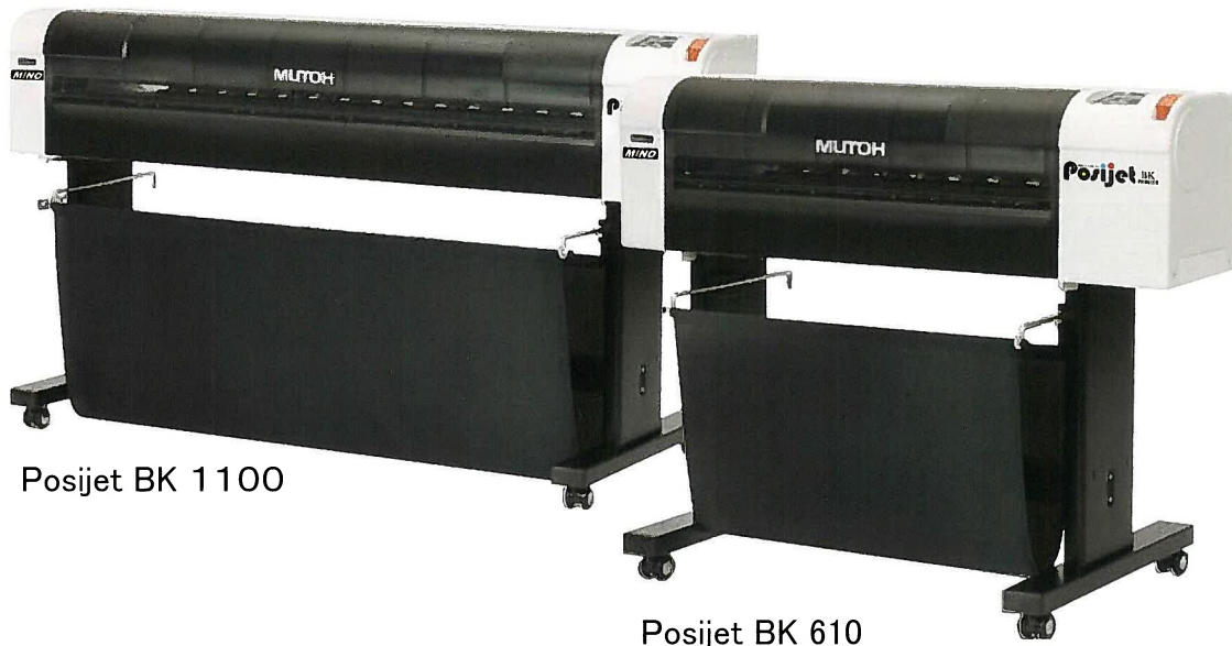
Posijet BK 1100