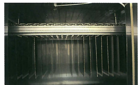
炉内の吊り下げ状態